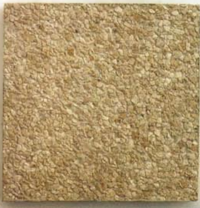
MACHAQUEO BLANCO N° 4